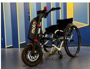
Monteres på rullestol Art.nr: 100051 / HMS art.nr: 317484