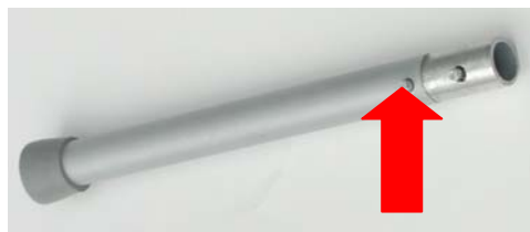
Fig 1. Trykkes inn for å feste og utløse foten.

TS monteres enkelt ved å klemme inn den nedre knappen (fig.1) på benene, og sette de i festene på undersiden. Benet vris til det er låst.